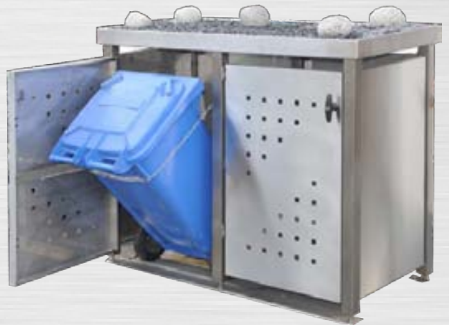
Z-MUSTER / ABSPERRBAR