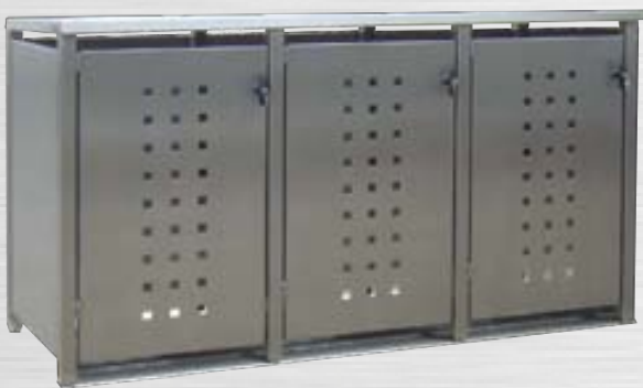
A-MUSTER / ABSPERRBAR